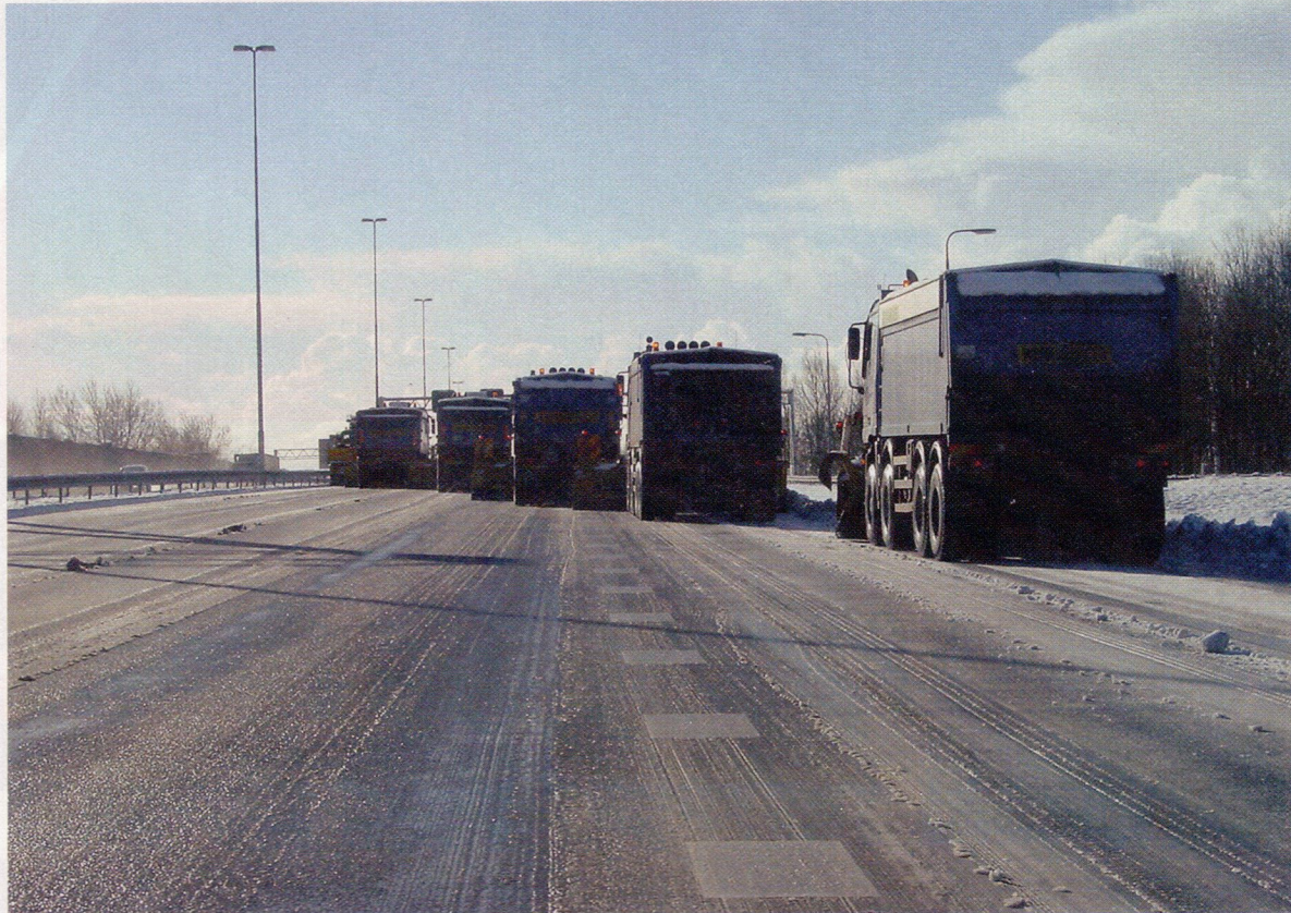
Kwam te laat op gang in het desastreuze weekend: sneeuwruimen op de snelweg.

Het team Video Registratie Onopvallende Surveillance (VROS) is een onderdeel van de Verkeerspolitie van het Korps Landelijke Politie Diensten. Het rijden met een onopvallend surveillancevoertuig vereist een zeer hoge rijvaardigheid. Omdat weggebruikers de onopvallende auto niet opmerken, brengt dat tijdens het rijden met hoge snelheden, vergeleken met een normale politieauto, extra risico's met zich mee. De auto's zijn voorzien van een videocamera met beeldscherm, gekoppeld aan apparatuur om de snelheid te meten. Het VROS-team heeft elf videoauto's, ze zijn uitgerust met de zogenaamde 'Triptrack', een apparaat dat snelheid, tijd en afstand meet. De vloot videoauto's bestaat uit auto's met een top van minimaal 240 km/h en tussen de 210 tot 240 pk. Men heeft de beschikking over een Opel Vectra GTS 3.2 V6, een Renault Laguna 3.0 V6, twee Citroëns C5, een Volvo V50 T5, en een Mercedes C 270.