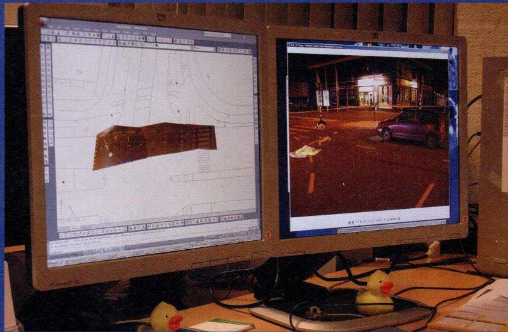
Op het bureau 'onthoekt' Bakema de beelden met een speciaal programma om een samengevoegd geheel te krijgen.

Haaksema: "Motorsurveillanten van het Team Verkeerssurveillance behandelen in principe alle verkeerszaken, ook zware transporten en taxiconroles. Wij ondersteunen daarnaast de wijkbureaus bij verkeersacties, zijn vraagbaak en worden regelmatig ingezet bij grootschalige optredens of de begeleiding van hoogwaardigheidsbekleders en ambulances. Soms geven we collega's of andere hulpdiensten voorlichting over hoe zo min mogelijk sporen te vernietigen." Eind 2006 is binnen het Team Verkeerssurveillance een aparte groep medewerkers gevormd die zich fulltime bezighoudt met de