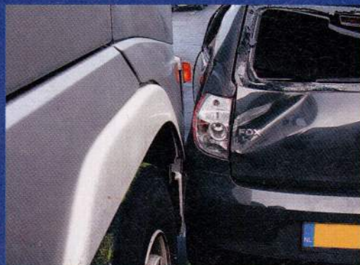
Reconstructie achteraf met inpassen botsingshoek.

"Vanwege de complexiteit van het hedendaagse verkeer kan het bijna niet anders of weggebruikers maken fouten", vervolgt Haaksema. "Aan elk verkeersongeval ligt in principe een overtreding van een verkeersregel ten grondslag. We maken echter niet altijd proces-verbaal op en het Openbaar Ministerie vervolgt niet in alle gevallen. Bij lichte aanrijdingen met materiële schade in elk geval