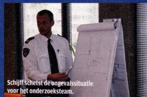
Schijffschetst de ongevalssituatie voor het onderzoeksteam.